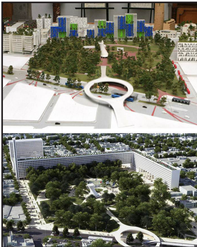
Imagen 2. Las dos propuestas de las Villas Panamericanas en la zona del parque Morelos en el Centro Histórico de Guadalajara.

El rechazo de los diferentes grupos sociales y académicos al proyecto, la disociación de la propuesta de la realidad urbana y ambiental del lugar, fueron algunos de los inconvenientes que se presentaron respecto al proyecto en el centro, así como las críticas hacia los excesivos gastos que se estaban realizando y, por supuesto, la elaboración y aprobación apresurada de los planes parciales de la zona – inexistente al momento de lanzar la convocatoria – en el que se justificaba el cambio de usos del suelo y densidades de edificación para asegurar su construcción. 17 Pero el factor determinante para su cancelación definitiva fue el rechazo por parte del Presidente de la ODEPA (Organización Deportiva Panamericana), Mario Vázquez