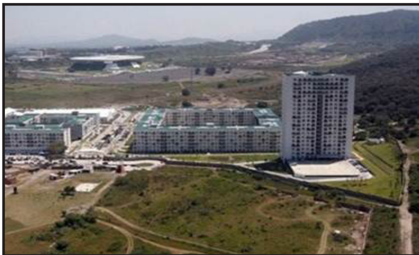
Imagen 3. Las Villas Panamericanas en la zona de El Bajío.