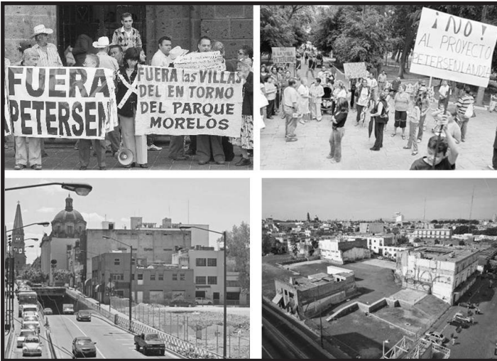
Imagen 4. Manifestaciones de la sociedad y aspectos de la zona entorno del Parque Morelos.

parte de la Comisión de Asuntos Metropolitanos del Congreso del Estado, 39 donde se enuncian diversos exhortos a las autoridades competentes de los tres niveles de gobierno (municipal, estatal y federal) que se encuentren implicadas en las obras de edificación de los Juegos Panamericanos 2011 para resarcir el daño generado. En dicho documento se exponen los resultados de un foro de especialistas, académicos y ciudadanos que razonaron en relación a la construcción de la villa, así como el estadio Omnifilé en la zona del Bajío, 40 y donde se expresa la inconformidades respecto a las decisiones que han tomado las autoridades del Gobierno del Estado “... al hacer caso omiso de las recomendaciones que han surgido del análisis de otras autoridades así como de los mismos ciudadanos afectados, quienes han señalado la inminente afectación a la zona y a las cuencas hídricas”. 41 Al respecto, con uno de los expertos y asesor del Parlamento de Colonias, el Dr. Eloy Ruiz, comenta: