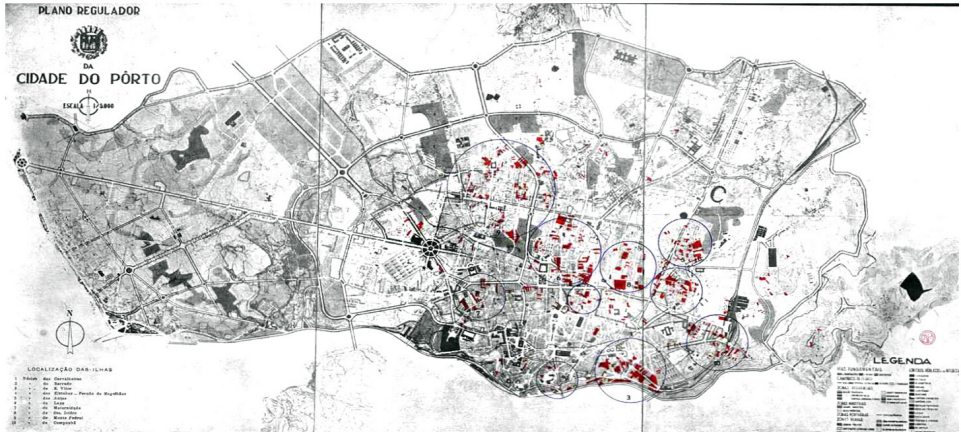
Mapa 1 - "Ilhas" a serem demolidas (CMP, 1956)

Quando olhamos para a localização dos Bairros Camarários efetivamente construídos dez anos depois percebemos que a imensa maioria dos novos conjuntos está localizada nas periferias, algumas delas muito afastadas. No Mapa 2, podemos ver em vermelho a localização dos Bairros Camarários construídos e em rosa as zonas de ilhas que foram demolidas: